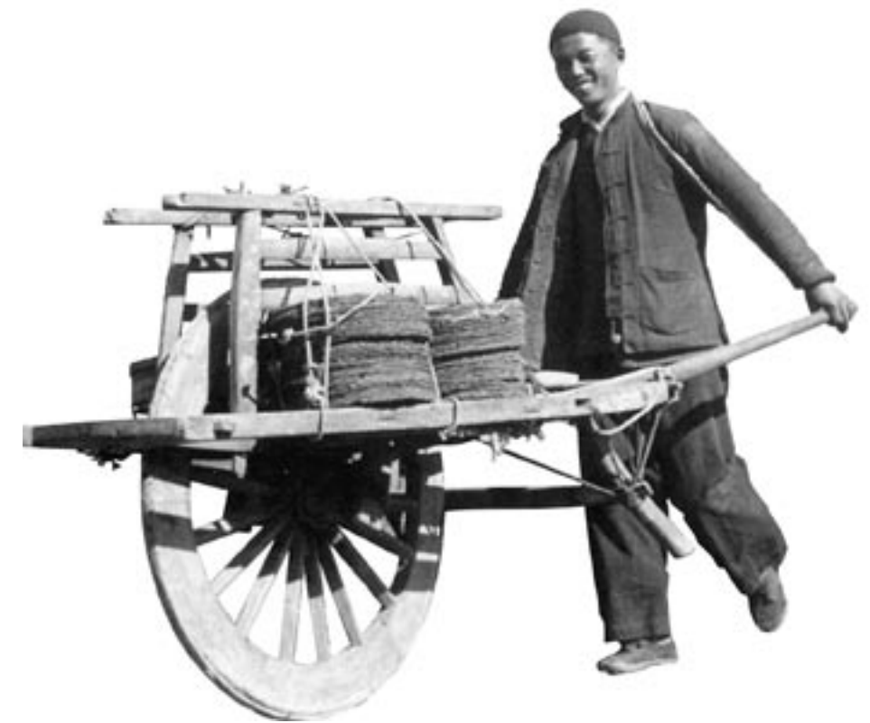
Traditionele Chinese kruiwagen. (foto dateert uit 1938)

‘Het leren van de meester is traditiegetrouw een vorm van verering.’